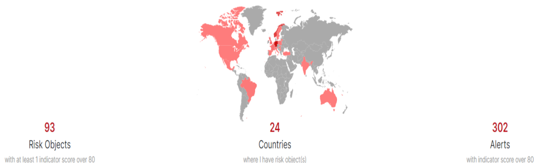
Image & Compliance risk area summary

Speira har i dag 4721 leverandører og forretningsforbindelser. Speira har tatt i bruk Sphera Supply Chain Risk Management (SCRM) (se beskrivelse under). Etter SCRM gjennomføres kontroll av alle leverandører kontinuerlig. Basert på vurderinger er det identifisert 893 kritiske leverandører. Av disse har 93 leverandører fått treff i området «Image&Compliance» med 302 varsler. Grafisk fremstilt som følger: